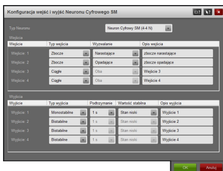
Rysunek 3: Okno konfiguracji wejść i wyjść Neuronu Cyfrowego SM

Dla każdego wejścia i wyjścia można skonfigurować opis, który będzie widoczny podczas konfigurowania warunków i akcji związanych z danym portem. Rysunek 3 przedstawia okno konfiguracji wejść i wyjść urządzenia. Kliknięcie przycisku OK powoduje zapisanie konfiguracji oraz zamknięcie bieżącego okna. Kliknięcie przycisku Anuluj powoduje zamknięcie bieżącego okna bez zapisania zmian w konfiguracji.