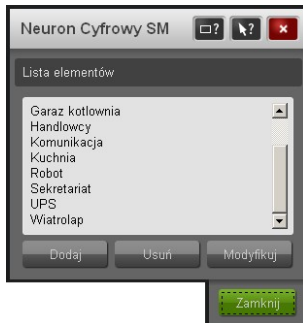
Rysunek 1: Lista elementów Modułu Neuronu Cyfrowego SM