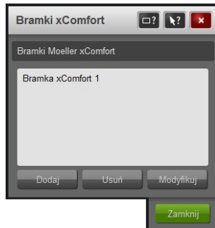
Rysunek 1: Lista urządzeń interfejsowych